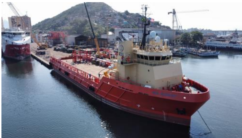
Figura 1 – Embarcação Mr. Sidney