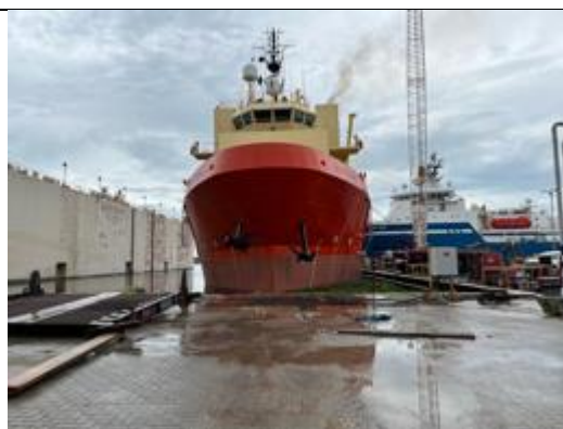
Foto 8 - Proa